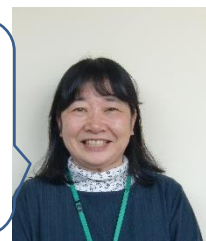
【上原図書館支援員】