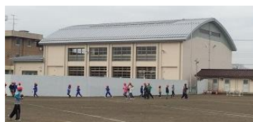
(完成間近の体育館)

さて、去る2月13日に実施された学校評議員会で、今年度の教職員・保護者の学校評価の結果および児童の様子等を5人の委員の方に報告し、ご意見をいただきました。まとめは近日中に配布いたしますが、概ね昨年度同様（保護者の回答の中で「よくあてはまる」「ややあてはまる」のプラス回答が、H25年度は92%、H26年度は93%）でした。学校生活では「学校では教育活動について分かりやすく伝えている」、家庭生活では「朝ごはんをしっかりと食べさせるようにしている」の評価が特に高かったです。反面、家庭生活で「テレビやゲーム等の時間を決めさせ、けじめある生活をしている」「子どもと将来の夢や生き方について話し合ったり、語り合ったりしている」ができていないという評価が比較