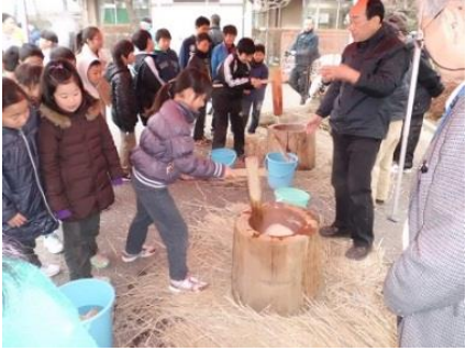
2/8(日) 餅つき・繭玉・小豆粥作り