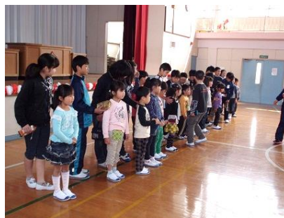
1年生の自己紹介(名前紹介)