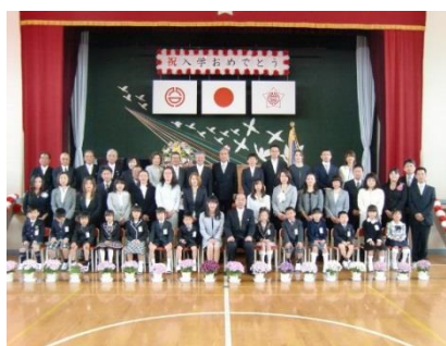
来賓・保護者と一緒に記念撮影