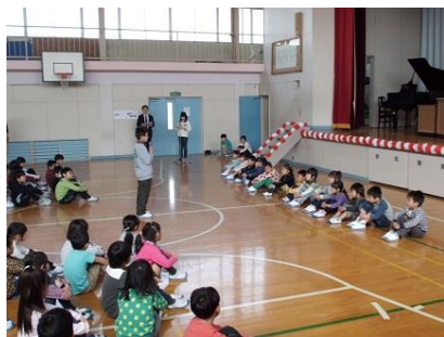
児童会長の歓迎の言葉