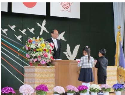
教科書並びに記念品授与