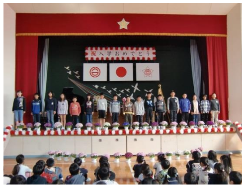
児童代表の言葉 (新6年生全員)