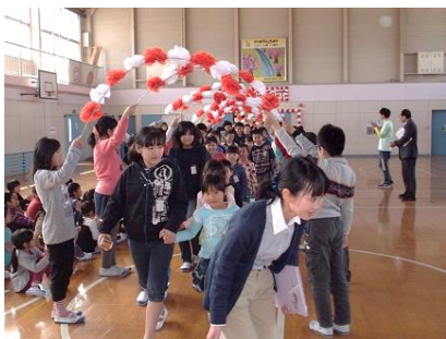
花のアーチの中、入場